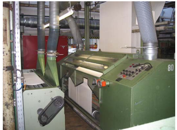
Einzyylinder Schermaschine – Monforts