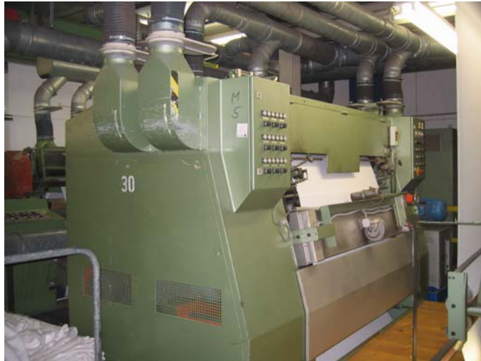
Holthausen Doppelquerbürste mit Infrarotheizung