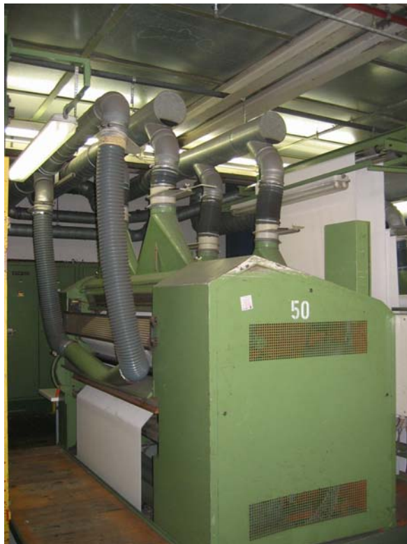
Auslauf Seite mit Schläger