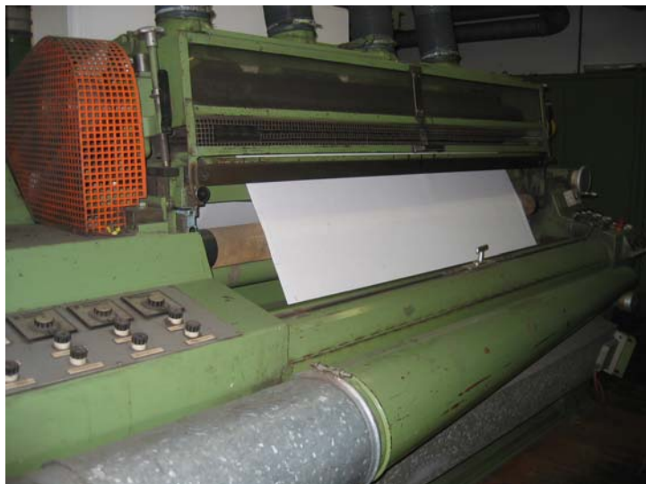
Holthausen Einzylinder Schermaschine