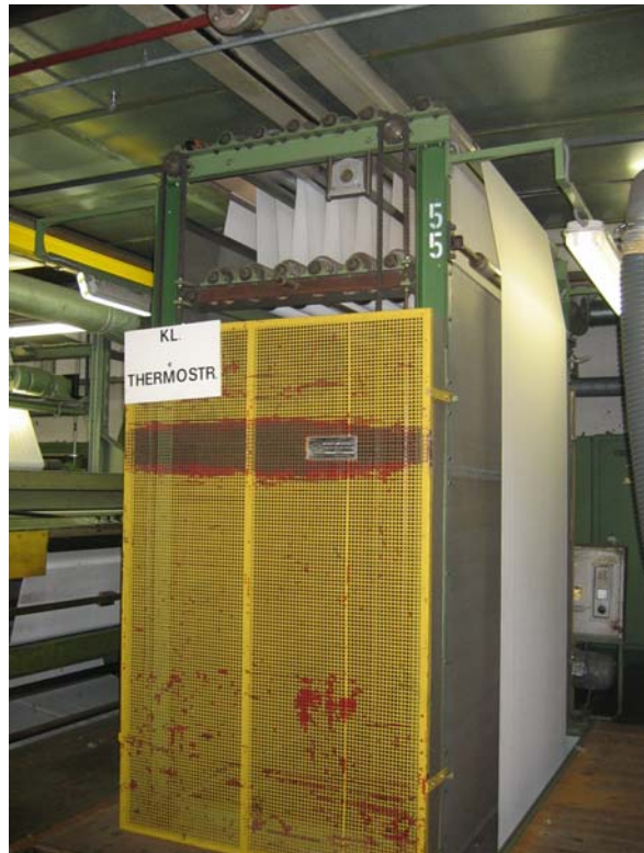
Brand Walzenspeicher für für NON – STOP Betrieb