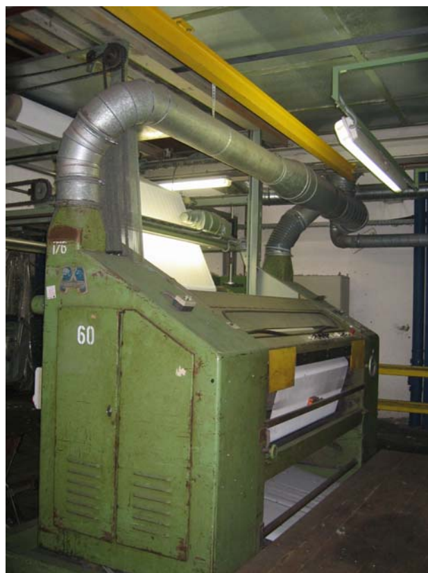
Einzyylinder Schermaschine Fabrikat Monforts