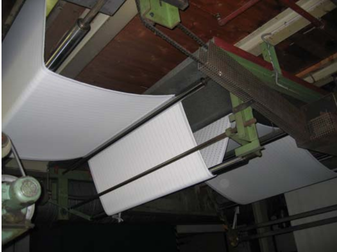
Überführung vom Spannrahmen Auslauf zum Holthausen Warenspeicher , Baujahr 1991 ,