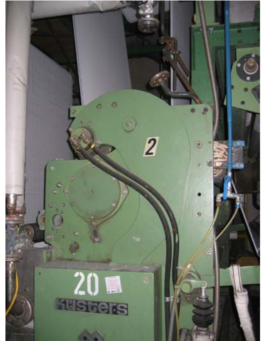
Entwässerungsfoulevard Küsters , alternativ Vacuumabsaugung , Fabrikat Evac , Heiztrommel zum Vortrocknen