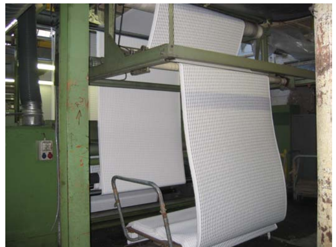
Einzelcylinder Schermaschine , Holthausen – Front- und Auslaufseite mit Wandertafler Holthausen