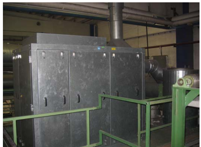
Vakuum Balken EVAC zur schonenden Entwässerung