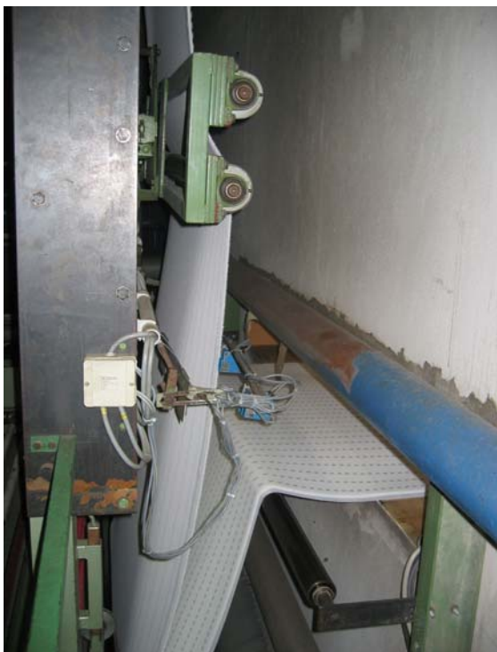
Warenbahnmittenführer am Auslauf des Hängespeichers , Übergabe auf das Stabförderband .