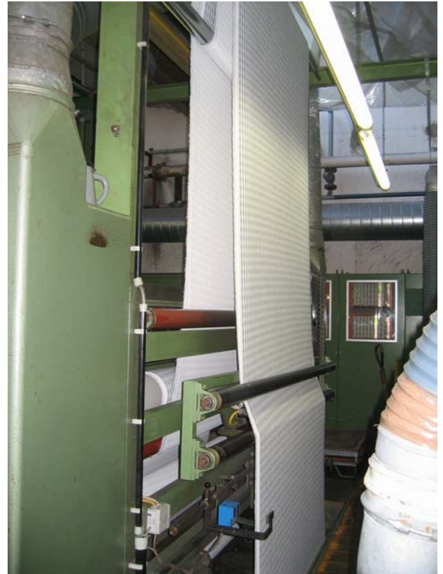
Einzelcylinder Schermaschine , Monforts – Einlaufseite / Auslaufseite mit Warenbahnmittelführer