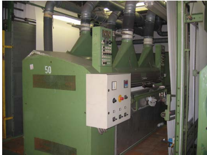
Zweite Doppel Thermorauhmaschine Holthausen